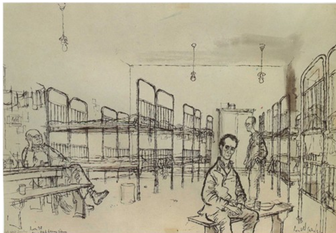
6. kép. Hálóterem a bécsi Karls-kaszárnyában. Webb–Searle, 1960b: 11.

Searle-ék az egyik legkiszolgáltatottabb és az emberekből a legtöbb együttérzést kiváltó menekültcsoportra, a kiskorúakra is felhívták a figyelmet. 27 Ennek azzal is