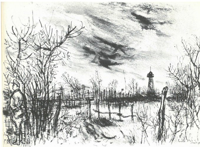
2. kép. Az osztrák–magyar határ Mörbischnél. Webb–Searle, 1960b. 3.

Searle négy különböző ausztriai helyszínen összesen öt grafikát készített tizenöt magyar menekültről, igaz közülük Webb csupán öt személy, illetve család történetére tért ki a szövegben. 18 Már a kötet elején nyilvánvalóvá vált, hogy a magyar menekülteknek fontos szerep fog jutni a riportázsban. Ennek egyrészt a nemzetközi menekültsegélyezés sikertörténetének tekintett 1956-os magyar menekültválság megoldásának időbeli közelsége volt az oka, másrészt az, hogy még mindig sok magyar menekült élt osztrák táborokban. 19