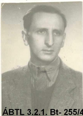
ÁBTL 3.2.1. Bt- 255/4

1955. december 10-én dobták át a határon a „Kerekes Mihály” fedőnevű ügynököt 44 az ekkor már szabad Ausztriába.