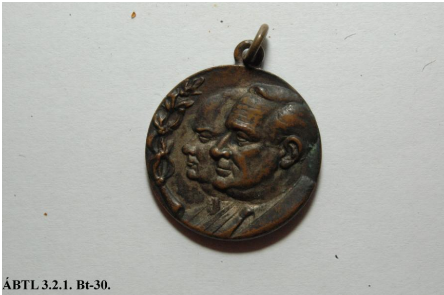
ÁBTL 3.2.1. Bt-30.

A spanyol polgárháborús emlékérem (spanyol nyelvű, magyarra fordított felirata: „Egyesülve biztosítjuk ennek a szabadságharcnak a győzelmét”) tulajdonosa egy „Magyar Erzsébet” fedőnevű ügynök volt. 17