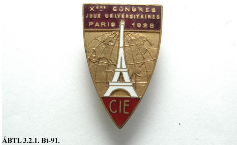
ÁBTL 3.2.1. Bt-91.

Az 1928-as párizsi egyetemi játékok kítűzője egy „Fertői” (később „Fairfield”) fedőnevű ügynök működésével kapcsolatos. 9