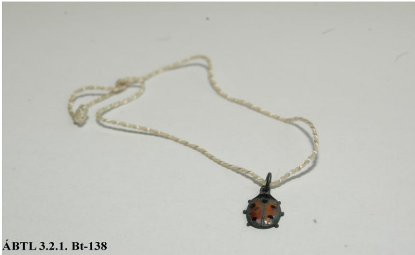
ÁBTL 3.2.1. Bt-138

A katicabogarat ábrázoló medál egykori tulajdonosa a „Sugár” fedőnéven szervezett ügynök volt. 3 A Rózsaszigeti Kálmán színiiskolájában végzett színész- és táncosnőt édesanyjával együtt 1951-ben azzal az indokkal telepítették ki Budapestről a Békés megyei Gerendásra, hogy – 1944-ben munkaszolgálatosként elhunyt – férje korábban nagykereskedő volt. 4