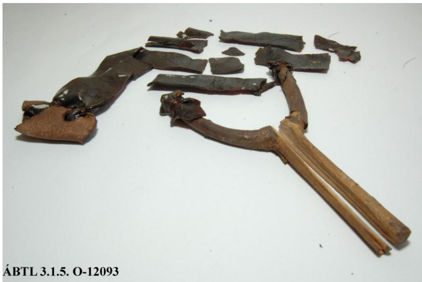
ÁBTL 3.1.5. O-12093

Így újra a „csúzlival történő elkövetés gyanúja” került előtérbe. A feltételezést erősítette az is, hogy az Egyesült Izzóval szembeni Lakk- és Festékipari Vállalat – melyről minden kétséget kizáróan megállapították, hogy onnan lőtték ki a lövedéket – udvarán találtak egy csúzlit (ezt szintén a