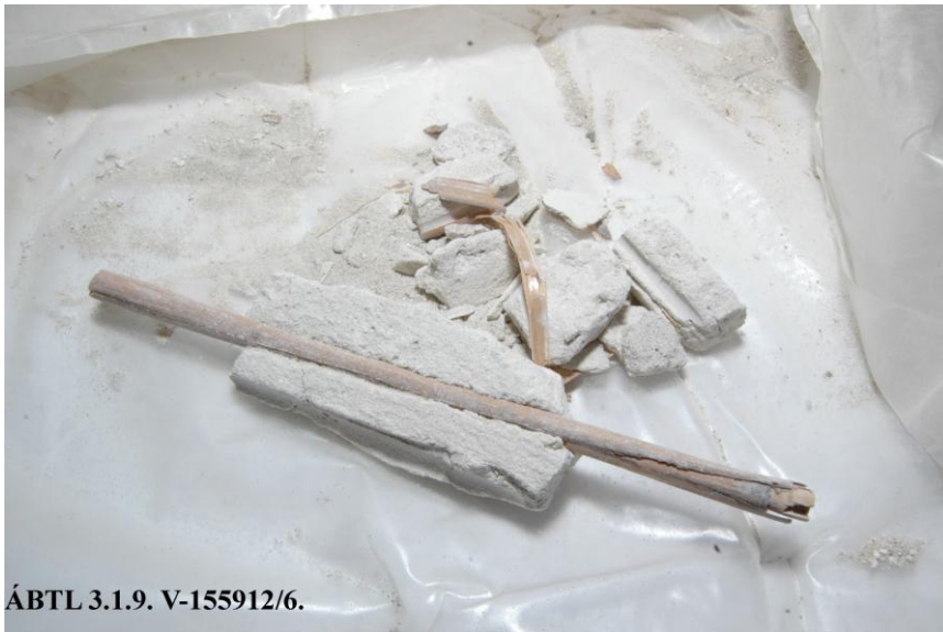
ÁBTL 3.1.9. V-155912/6.