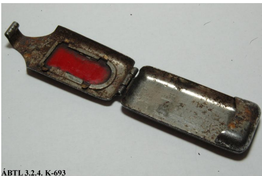
ÁBTL 3.2.4. K-693