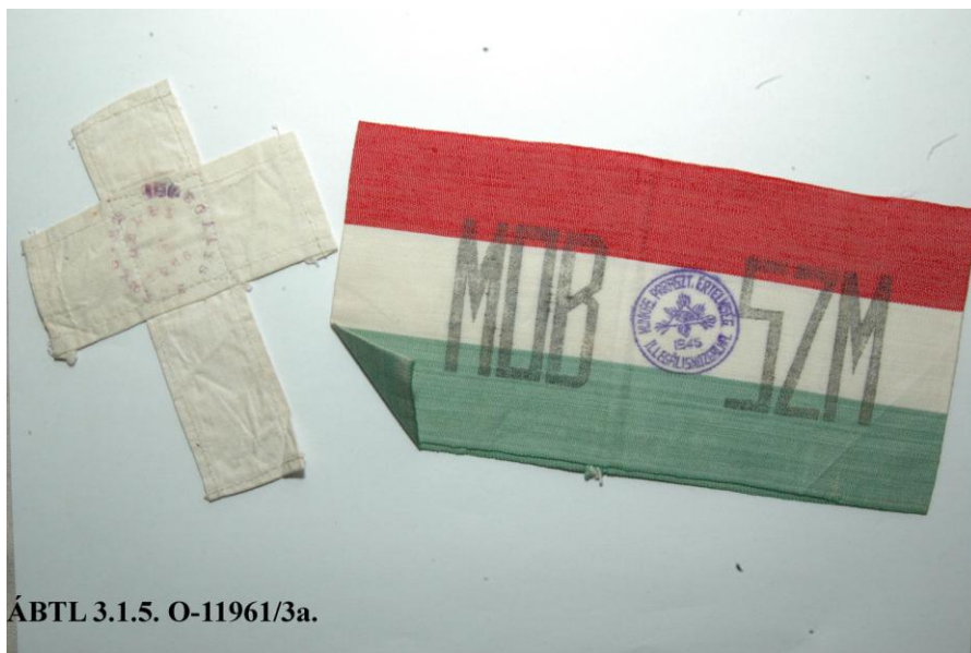
ÁBTL 3.1.5. O-11961/3a.

1951 tavaszán Budapest több pontján, Székesfehérváron, Sátoraljaújhelyen, valamint Miskolcon és környékén több ezer példányban röpcédulákat szórtak. 33