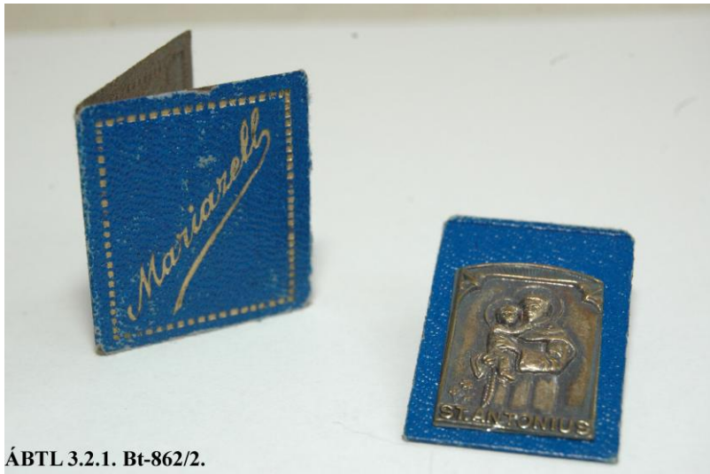
ÁBTL 3.2.1. Bt-862/2.