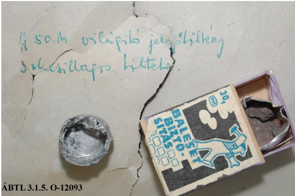
ÁBTL 3.1.5. O-12093

képeken látható, a helyszínen talált töltények, égéstermékek vizsgálata alapján azt állapította meg, hogy azok rakétapisztolyból származnak. Így a BM III/III-1-b alosztály két tisztje ellátogatott a fóti Dobó István tüzserész laktanyába, ahol egy kísérlet végrehajtása és ellenőrzése után arra az eredményre jutottak, hogy ugyan nem rakétapisztollyal, de lőtték a lövedéket, különben az nem tudta volna áttörni az ablakot.