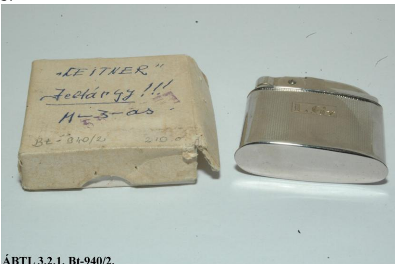
ÁBTL 3.2.1. Bt-940/2.

Az L. Gy. monogramot viselő Mofém Meteor márkájú öngyújtó az „Ottó” (majd „Lócsei Béla”, végül „Franz Leitner”) fedőnevű ügynökkel való kapcsolatfelvételt szolgáltatta. 8 A banktisztviselő, de újságírással is foglalkozó ügynök a felszabadulás után önként ajánlotta fel szolgálatait a politikai rendőrségnek.