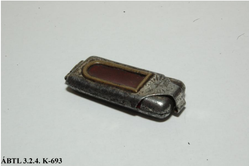
ÁBTL 3.2.4. K-693

A képen látható ereklyetartó a „B/F-8” fedőszámú ügynökkel való kapcsolatfelvételt szolgálta. 12