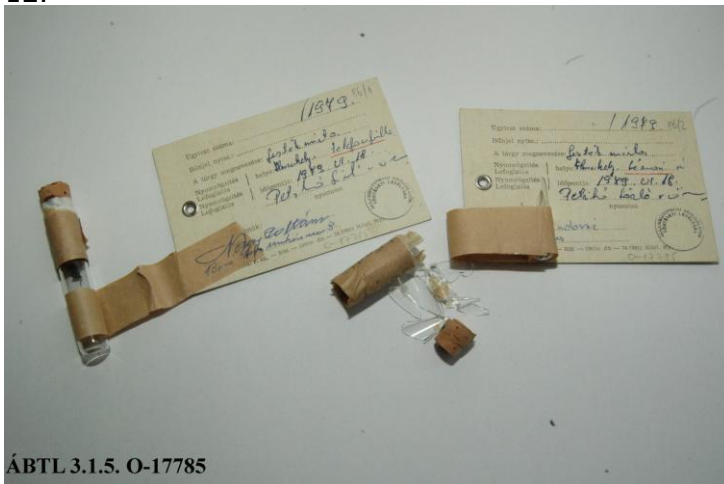
ÁBTL 3.1.5. O-17785

Néhány héttel később valaki a szolnoki Léna étterem férfi WC-jének falára horogkeresztet festett, s a falfirkálások ügyében egyébként is adatgyűjtést végző operatív tiszt ekkor találta meg a képen látható, Trianonra emlékeztető kis fémtáblát.