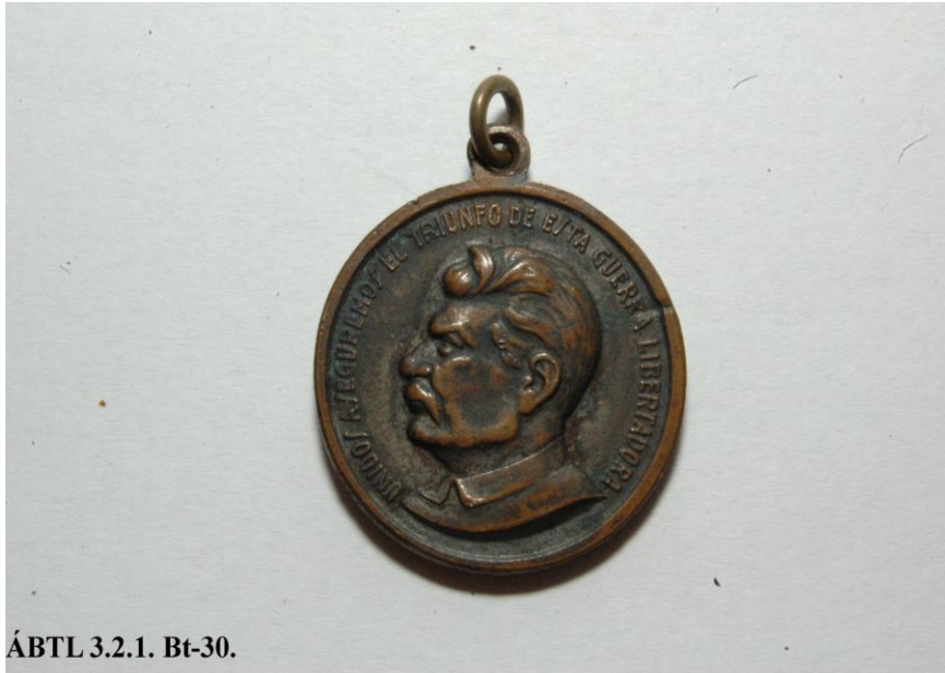
ÁBTL 3.2.1. Bt-30.

A spanyol polgárháborús emlékérem (spanyol nyelvű, magyarra fordított felirata: „Egyesülve biztosítjuk ennek a szabadságharcnak a győzelmét”) tulajdonosa egy „Magyar Erzsébet” fedőnevű ügynök volt. 17