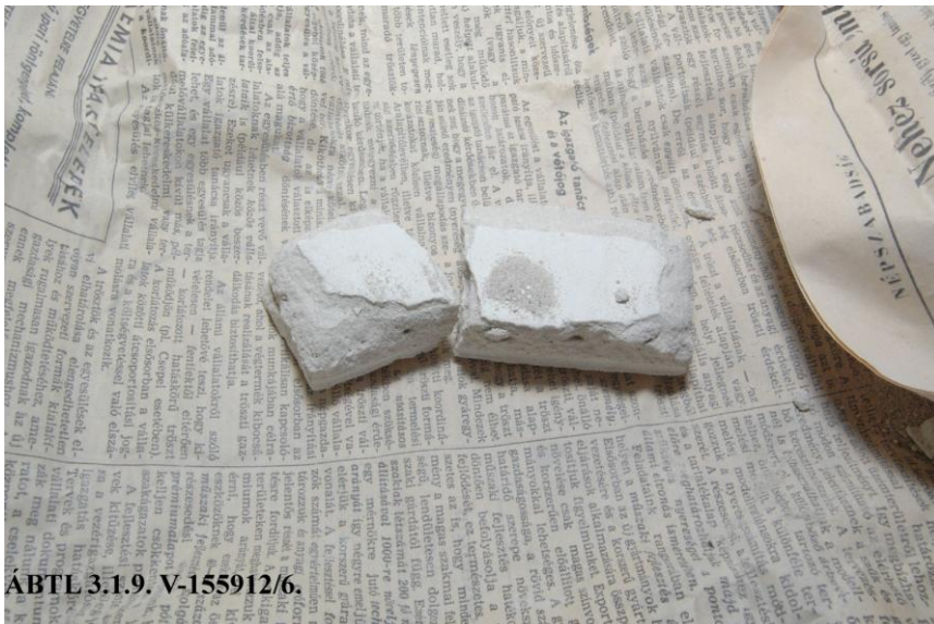
ÁBTL 3.1.9. V-155912/6.