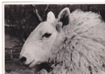
Cap de oaie Colbred

(ACNSAS fond OVS, 2871. dosszié, 16 kötet, 31.)