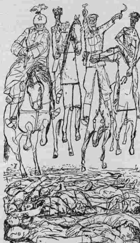
Szalay Lajos rajza

szinte hitté vált a lenini ideológia, egész életében ezzel viaskodott. Valamiféle befallzott evangéliumot érzett benne. Minél hidegebb és dermesztőbb lett a gyakorlat annál inkább próbálta igazolni magában az eszmei alapok igazságát. Kereste az útát. Nietsrchéig jutott vissza, — de ez már kiégett meteorokó volt a kezében. Hol az élet? hol az igazság? Kereste az útát.