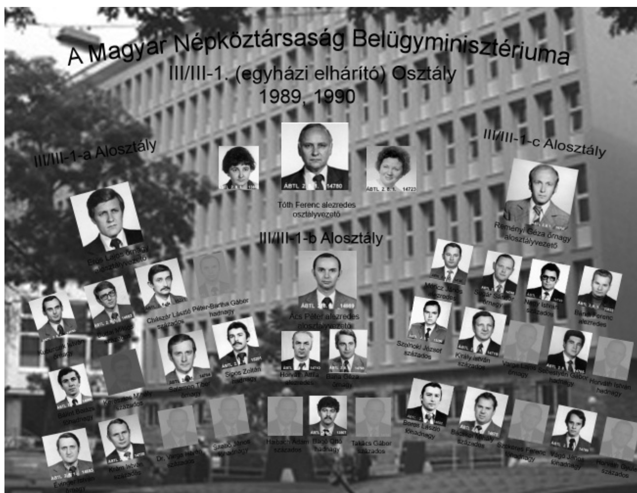
A BM III/III-1 Osztály munkatársai 1989–1990-ben

Az egyházi elhárítás (BM III/III-1. Osztály) 1989-es tablóján három tucat állambiztonsági tiszt helyezhető el. A személyi dossziékban megőrzött igazolványképek alapján grafikusán is elkészíthetővé vált egy minden bizonnyal sohasem létező osztálytábló. Ennek megalkotásához 27 fotót sikerült feltárni eddigi kutatásaim során, kilenc beosztottnak nem található személyi anyaga a levéltárban. Bár az összeállítás abból a szempontból is fiktívnek tekinthető, hogy a felvételek valószínűleg nem egy időpontban készültek, mégis e montázs révén szembesülhetünk először egy elhárítási terület teljes (központi) állományával.