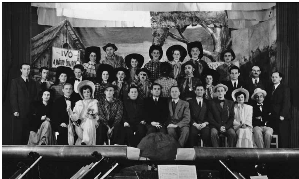
5. kép. Az 1954-ben bemutatott Leányvásár című operett szereplői 72

a helyi együttest. 68 Ugyanakkor Vasváron a munka zavartalanul folyt tovább. 69 Ennek a helyzetnek köszönhetően kaphatta meg a kőszegi fúvószenekar azt a politikai értelemben kitüntetett és látványos feladatot, hogy 1957. augusztus 20-án közreműködtek a szombathelyi munkásőr zászlóalj és a járási század zászlóavatási és eskütételi ünnepségén. 70 Mindezt egy kőszegi reggeli zenés ébresztőt követően. 71