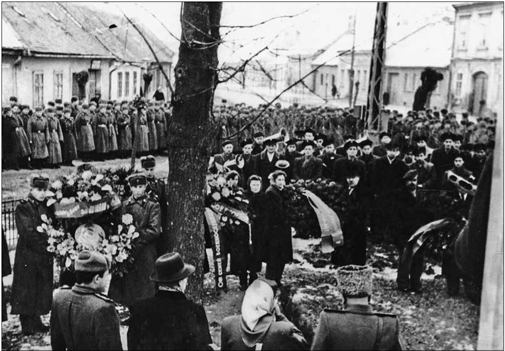
1. kép. Koszorúzás a kőszegi szovjet világháborús emlékműnél 5