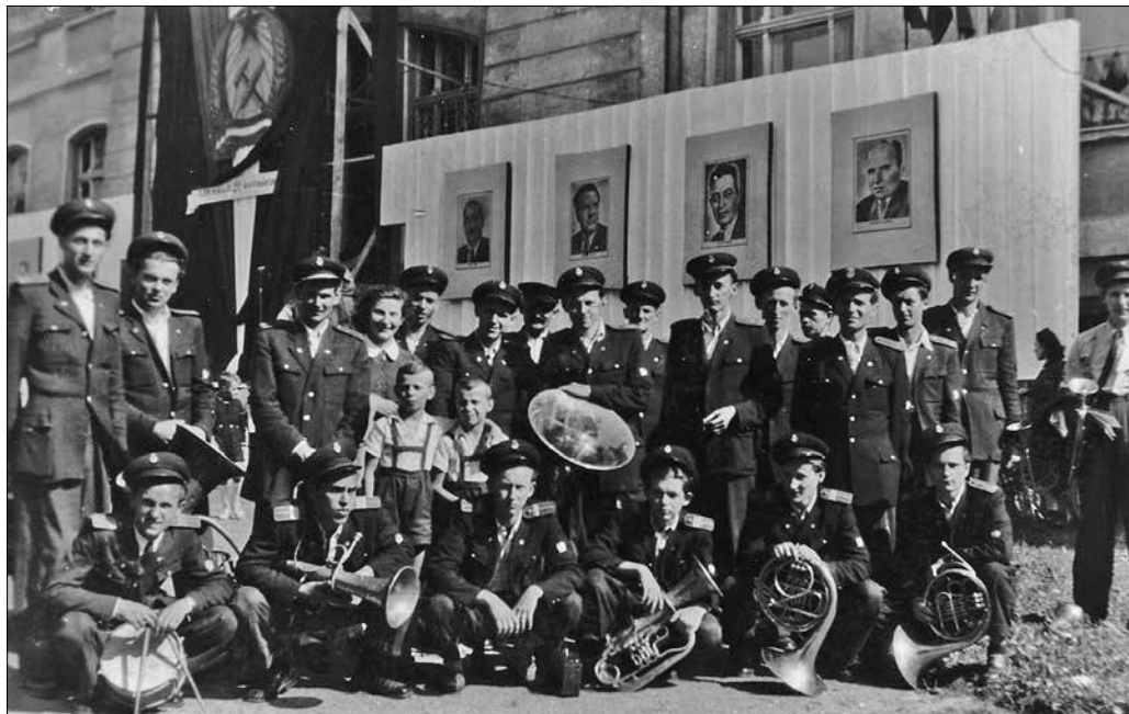
2. kép. 1954. augusztus 20-án Szombathelyen 23