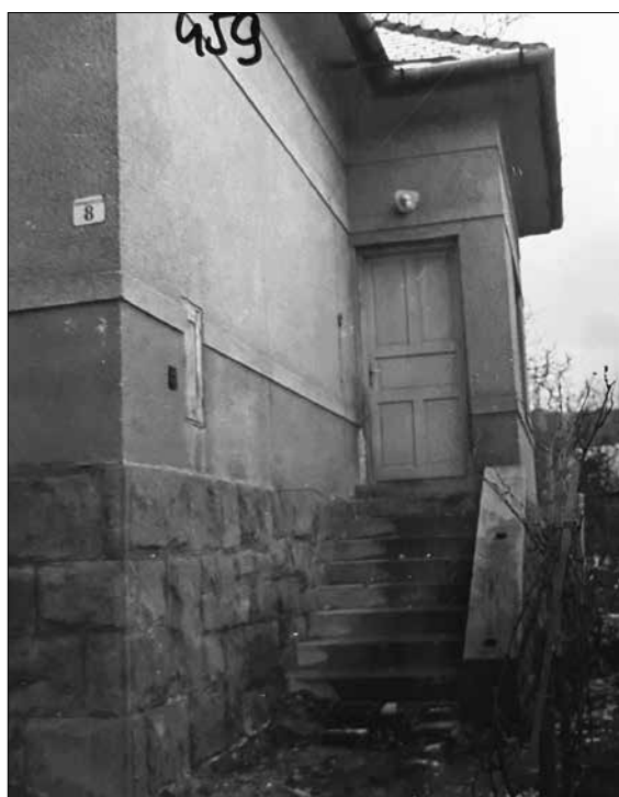
4. kép. A Sziklai-ház főbejárata 57