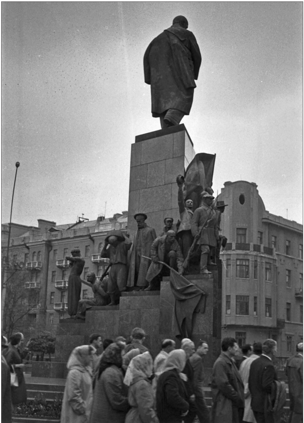
Élők és holtak. Tarasz Sevcsenko szobra Harkivban, 1965