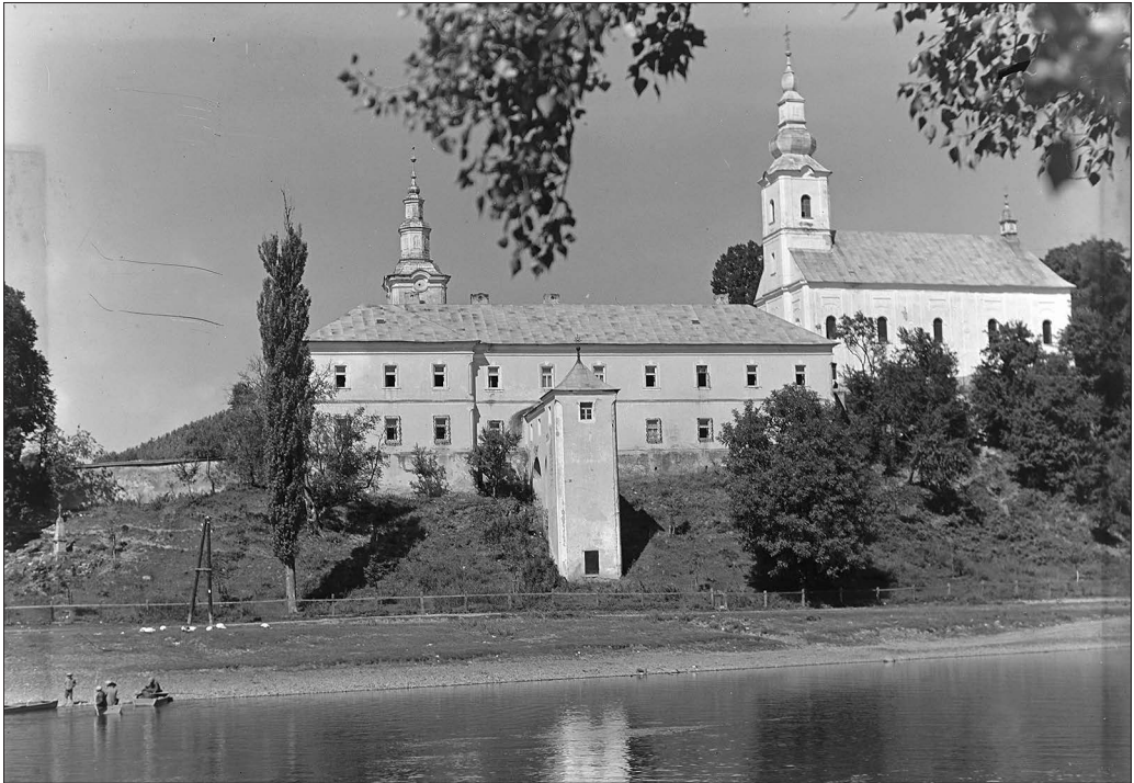
A csernekhegyi kolostor 1939-ben 44