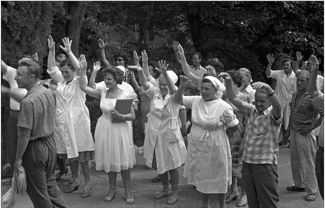
Búcsú a Krímtől, 1963