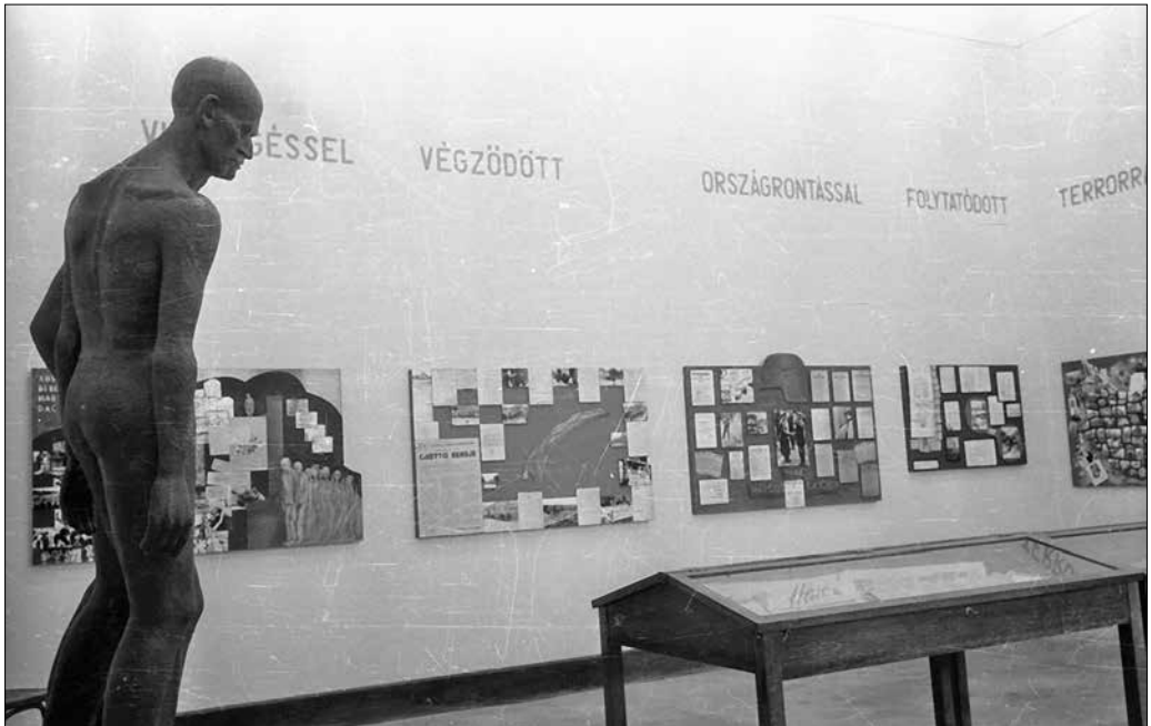
Szolgaságból szabadságba című kiállítás. Zsidó Múzeum, Budapest, Dohány utca 2., 1960.